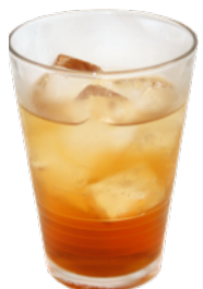
カルアコーヒー Kahlua Coffee