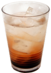
オレンジブロッサム Orange Blossom