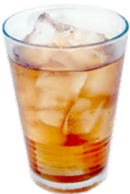
カルアミルク Kahlua Milk