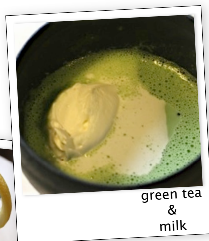
green tea & milk