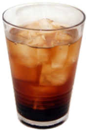
さき Bar Keeperオリジナルカクテル ユジン YUJIN